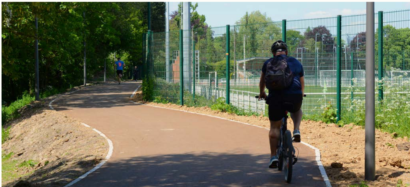
La nouvelle piste cyclable dans le bois de la Citadelle d'Arras.

Après avoir choisi de subventionner l'achat de vélo à assistance électrique, avoir mis en place un système de location longue durée de vélo à assistance électrique, la Communauté Urbaine d'Arras poursuit le développement des aménagements cyclables sur son territoire. Depuis le début de l'année 2018, des travaux ont été engagés pour créer des garages à vélos ainsi que des liaisons cyclables pour faciliter les trajets domicile-travail à l'aide de son vélo.